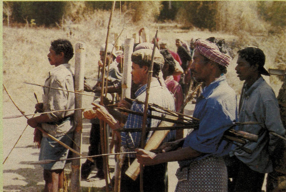
സമാന്തര രേണം അമ്പും വില്ലുമേന്തിയ ആദിവാസികൾ കാടുകളിലേക്ക് പുറമേ നിന്നുള്ള വർ കയറുന്നത് തടയാൻ മുത്തങ്ങ വനത്തിൽ സ്ഥാപിച്ച ചെക്ക് പോസ്റ്റ്

സഭയിൽ "സമാന്തരരേണമെന്നു നടത്തിയവരെ വെടിവെച്ചുതന്നു" ആക്രമിക്കുന്നതും ഈ വികാരത്തിന്റെ എഴുപതുകളെ ഓർമ്മിപ്പിക്കുന്നതും ആവർത്തനമാണ്. വാസ്തവത്തിൽ പുതിയ സമരമുറയോടെ ആദിവാസികൾ തങ്ങൾക്കനുകൂലമായി സമൂഹത്തിൽ തിരിഞ്ഞുവന്ന മനോഭാവത്തിന് വൻ തിരിച്ചടിയാണ് നൽകിയത്. സാദാവികമായും ഇപ്പോൾ തൽക്കാലമെങ്കിലും ചിരിയുന്ന ആദിവാസികളുടെ മണ്ണും മാനവും കാലങ്ങളായി കവർന്നു വന്നവരാണെന്നതിന് സംശയമില്ലല്ലോ.