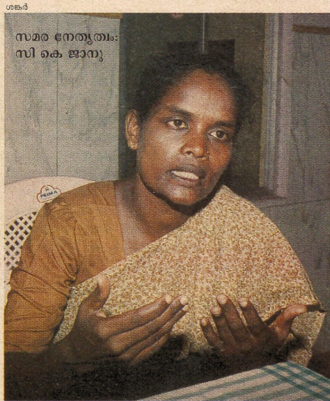
സമര നേതൃത്വം: സി കെ ജാനു