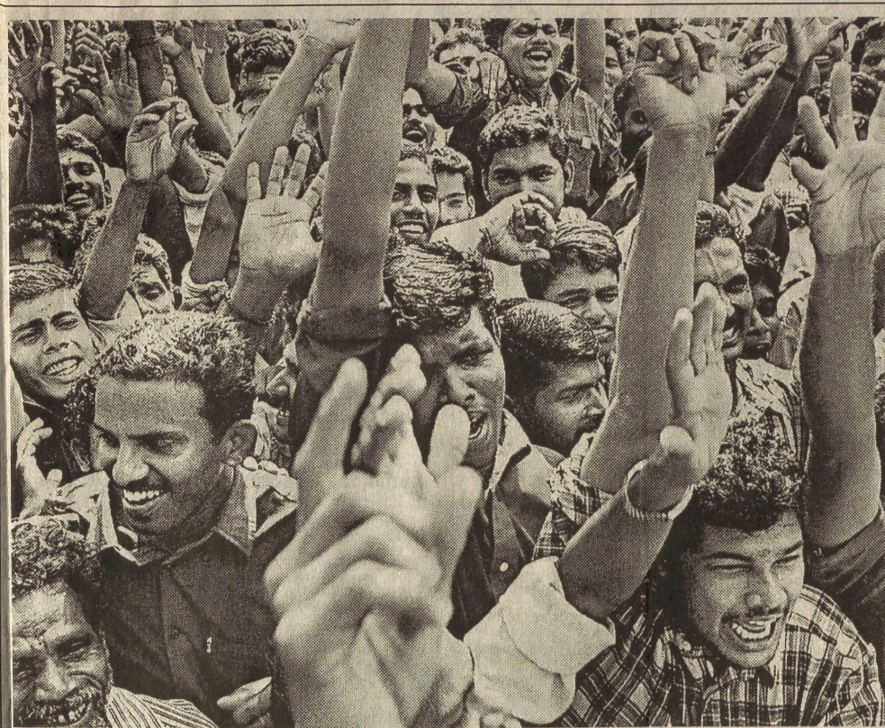
Devotees who gathered at the Sree Puthenkavu Bhagavathi Temple at Elavoor, near Angamaly, on Friday respond in a frenzied cheer to the announcement that a symbolic 'velupradakshinam' would take place instead of 'thookkam' which was banned by the authorities.

The Government should order a judicial inquiry to ensure that the corruption related to the signboard contract was brought to light and checked, he said.