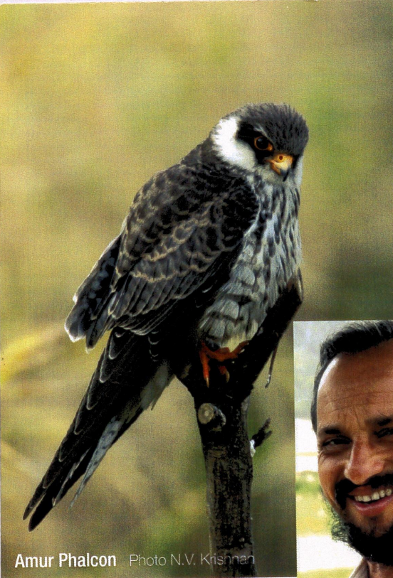
Amur Phalcon