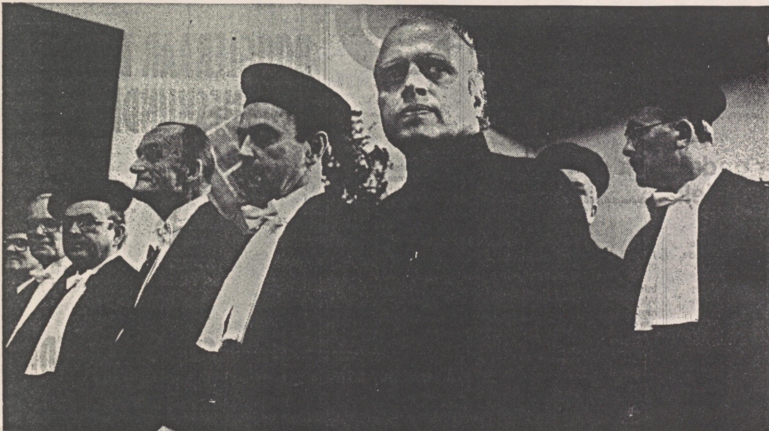
Dr M.S. Swaminathan (midden) tijdens de uitreiking van het eredoctoraat aan de Landbouwuniversiteit Wageningen.