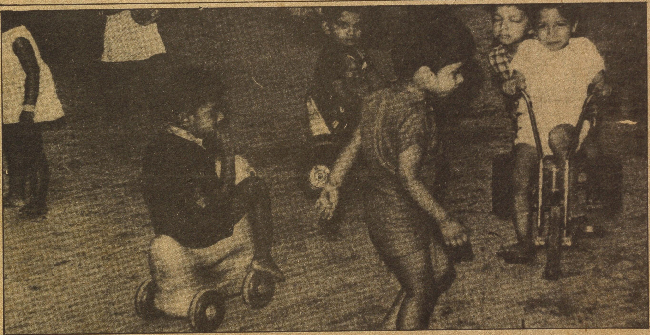
കളിക്കോപ്പകളുടെ ലോകം നമ്മുടെ എത്ര കണ്ണങ്ങൾക്കു വിധിച്ചിട്ടുണ്ട്?

ഇത്ര കളിക്കോപ്പകൾ—ഇത്രയൊക്കെയുണ്ടെങ്കിൽ അവിടെ കൂടുതൽ സമയം ചെലവഴിക്കാൻ കട്ടികൾക്ക് സാധാവികമായും ആഗ്രഹമുണ്ടാകും. ഒരു പ്രത്യേക സ്കൂളിലെ പരീക്ഷ എഴുതിപ്പിച്ചു, അവിടെ ഒന്നാംകുമാസ്സിൽ അഡ്മിഷൻ മേടിക്കുക എന്ന ലക്ഷ്യത്തോടെ ശിക്ഷണം നൽകുന്ന തിരക്കിൽ ഇത്രയൊക്കെ ചെലവുകൊടുക്കാൻ മറക്കരുത്. ഇതു നമ്മുടെ കട്ടികളോട് നാം കാണിക്കേണ്ട ഔദാര്യമല്ല, മറിച്ച് ഇതവരുടെ അവകാശമാണ്.