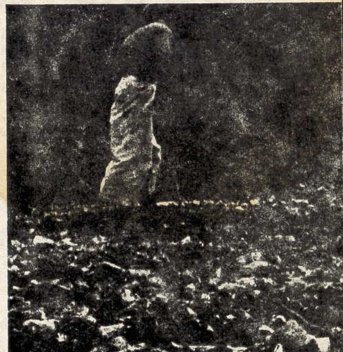
Miljögruppen i Wayanad förstör miljontals acaciaplantor som skulle ha förstört de naturliga grässlänterna.

- Vi vattnade våra frön noga, och informerade dem som ansvarade för plantskolan om hur de skulle sköta de nya plantorna, berättar Kul Bhushan med ett leende. Men departementets folk var inte intresserade, med undantag för mulbärsfröna som