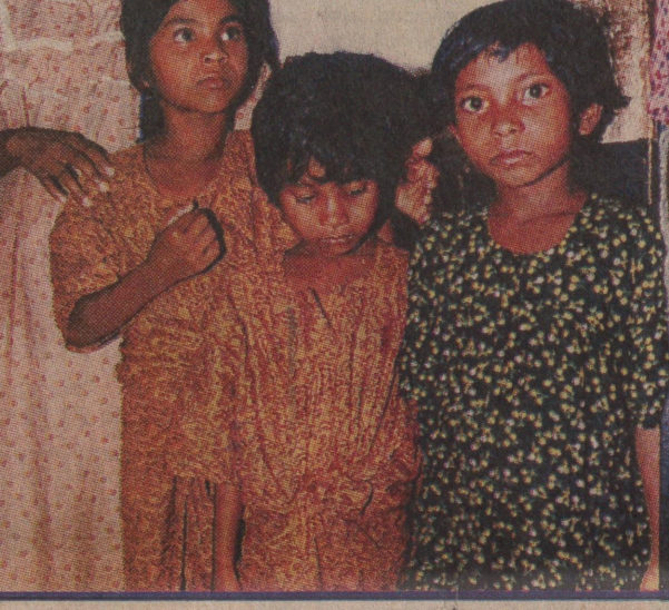
അമ്മയെ കാണാതെ, അമ്മിഞ്ഞയില്ലാതെ...

മാതാപിതാക്കൾ എവിടെയെന്നറിയില്ല. വെടിയൊച്ച കേൾക്കുമ്പോൾ ആകോശത്തിന്റെയും നടുക്കത്തിന്റെയും അവർ നിയമം മുക്തരായില്ല. കാക്കി വേദം കാനൂണുകൾ കട്ടികൾ വിരണ്ടുപോവുന്നു.