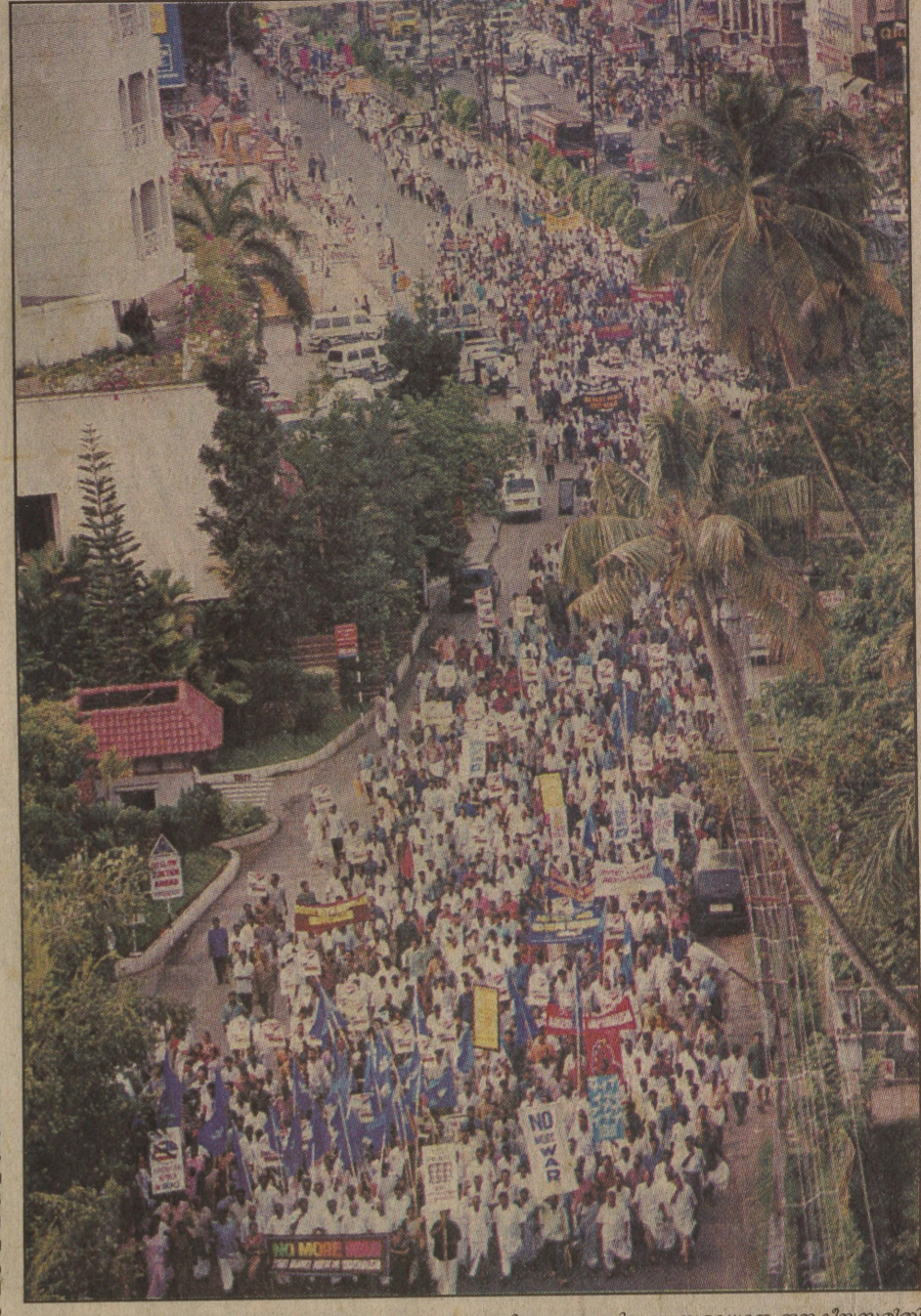
അമേരിക്ക ഇറാഖിൽ നടത്തുന്ന അതിക്രമങ്ങൾക്കെതിരായ യുദ്ധവിരുദ്ധ സമാധാന ജനകീയസമിതി എറണാകുളത്ത് സംഘടിപ്പിച്ച യുദ്ധവിരുദ്ധവാദി

കോഴിക്കോട് നഗ്നശിക്ഷിത നടപ്പാക്കും. പോലീസ് സ്പെഷ്യൽ കോർട്ടിലെ സംഖ്യ പുനർനിർണ്ണയിച്ചാണ് രണ്ട് വിഭാഗങ്ങളെക്കുറിച്ചാണുപേക്ഷിച്ച് നിലവിലെ പോലീസ് സംവിധാനം ഉപയോഗിക്കും.