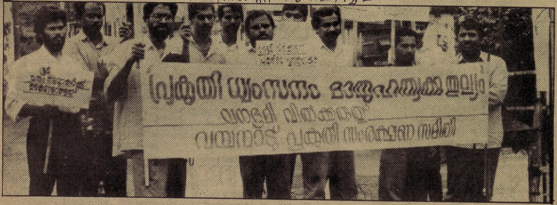
വയനാട് പ്രകൃതി സംരക്ഷണ സമിതിയുടെ ആഭിമുഖ്യത്തിൽ കലക്ടറേറ്റ് പടിക്കൽ നടത്തിയ ഉപവാസസമരം