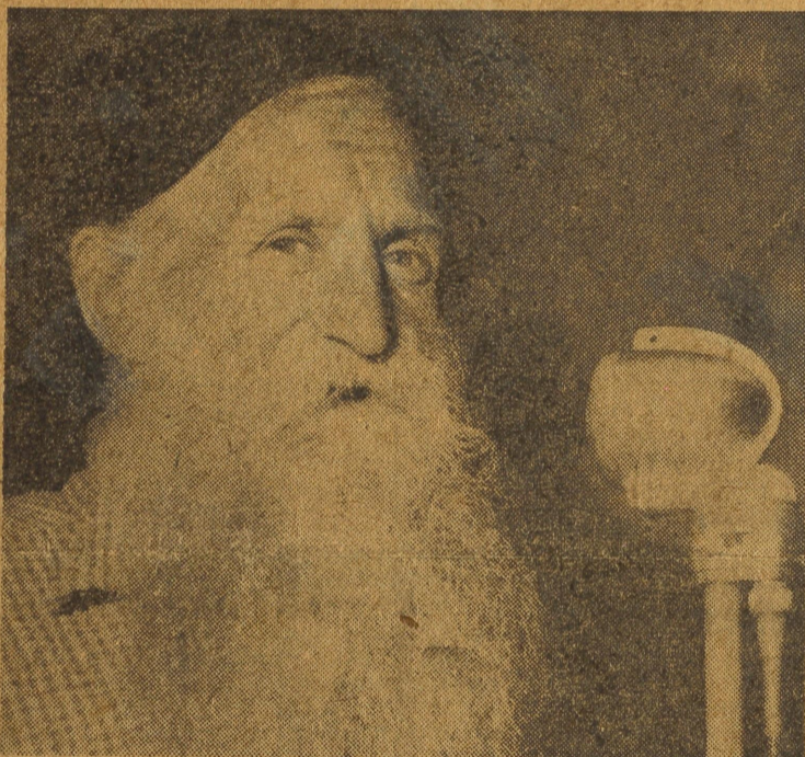
Stålfarfar framför mikrofonen på Stora scenen.